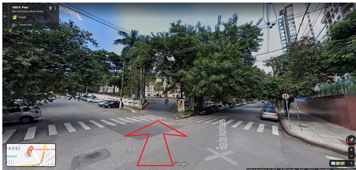
Portaria principal do 1º BBM

1.2. Data / Hora: conforme a “ Agenda do Candidato - Exames de Saúde – CFO BM 2021 ”.